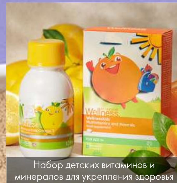
Набор детских витаминов и минералов для укрепления здоровья