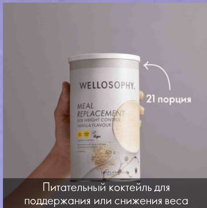
Питательный коктейль для поддержания или снижения веса