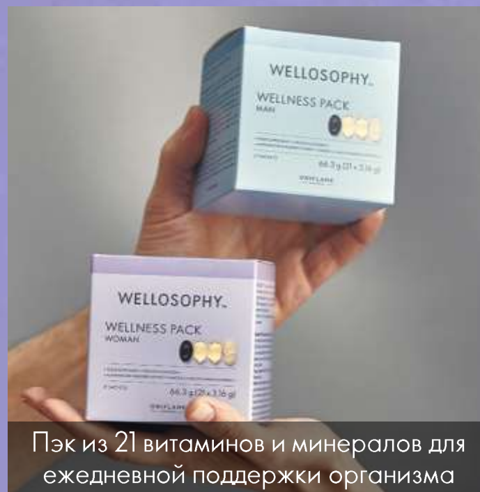
Пак из 21 витаминов и минералов для ежедневной поддержки организма