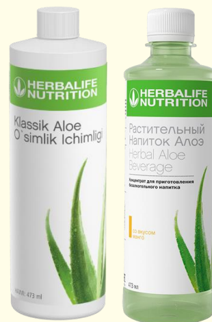
Растительный напиток Алоэ классический и со вкусом Манго