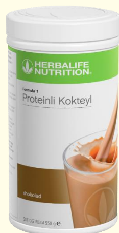
Формула 1 Протеиновый коктейль 5 вкусов в УЗ