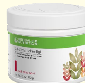
Овсяно- Яблочный напиток