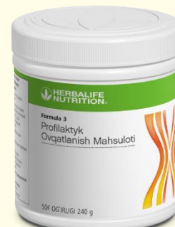
Протеиновая смесь Формула 3