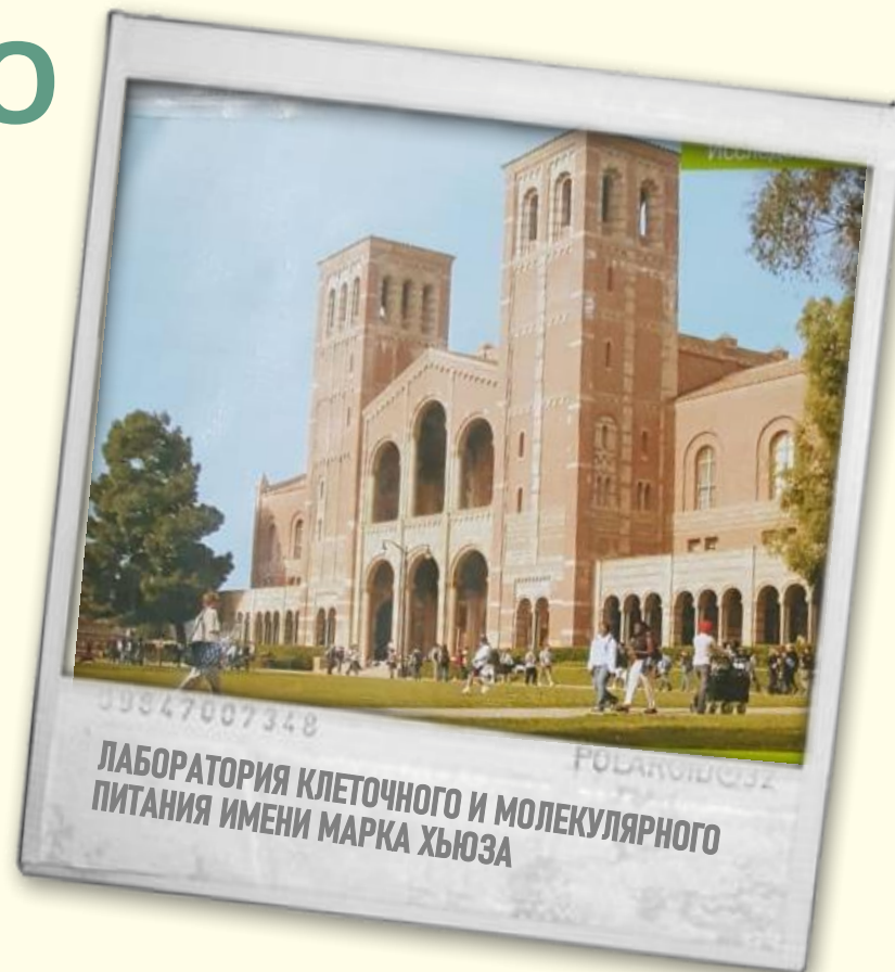
ЛАБОРАТОРИЯ КЛЕТОЧНОГО И МОЛЕКУЛЯРНОГО ПИТАНИЯ ИМЕНИ МАРКА ХЬЮЗА

NSF – гарантирует, что спортивная линейка продуктов имеет безопасные формулы и производится в соответствии с действующими стандартами